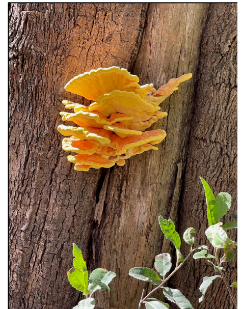
Hongos entre nosotros tomada en Point Pinole.